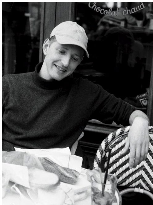
Yves Guillaume (Drehbuchautor und Regisseur)